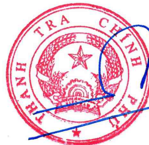
Dương Quốc Huy